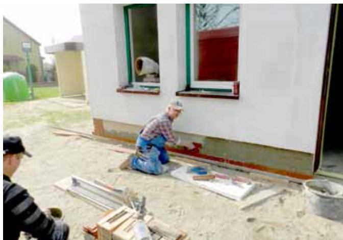
Świetlica po remoncie