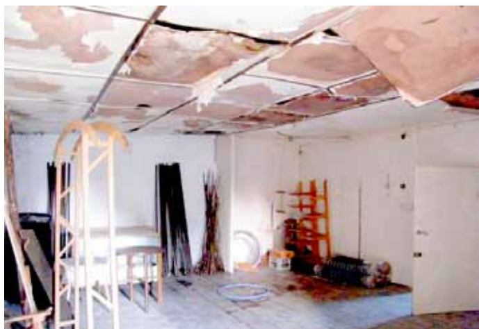
Świetlica przed remontem