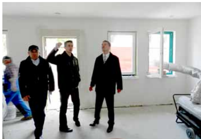
Świetlica po remoncie