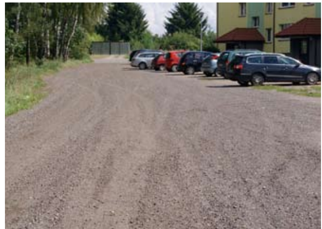
tak jest teraz